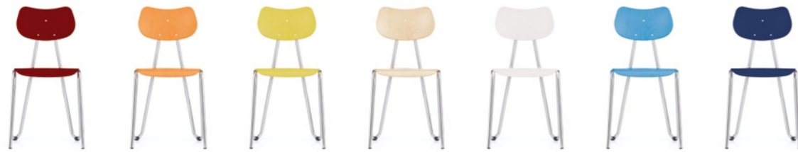
arno ist in 8 schönen Beiztönen erhältlich und eröffnet damit vielfältige Optionen in der Farbgestaltung.