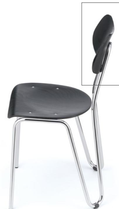
Ein besonderes ergonomisches Merkmal des arno Stuhles ist seine federnde Rückenlehne, die für einen überraschenden Sitzkomfort sorgt.